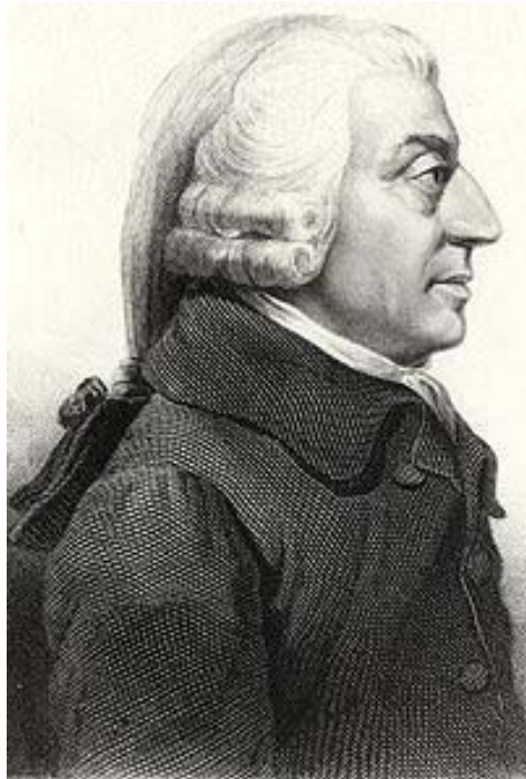
Adam Smith ( 1723-1790).

No es posible abordar los retos del bienestar colectivo con criterios exclusivamente científico-rationales, los juicios de valor son imprescindibles. ( Teorema de imposibilidad de Arrow ).