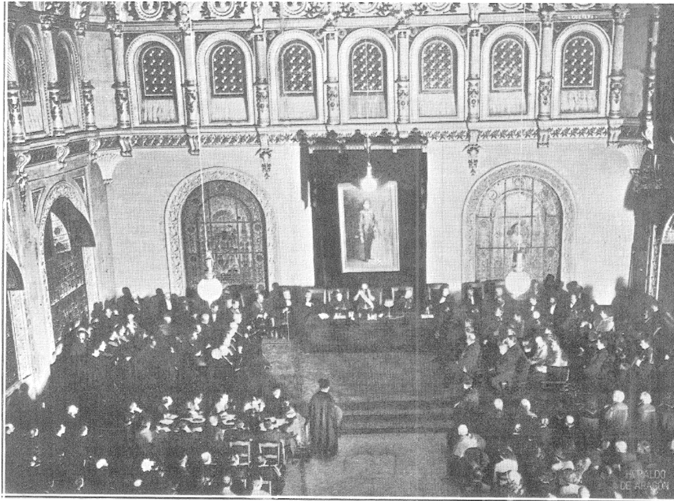
Inauguración del 1.º Congreso Nacional de Riegos, por el Excmo. Sr. D. Rafael Gasset, Ministro de Fomento, el día 2 de Octubre de 1913.

En octubre de 1913, el Presidente de la Diputación de Logroño D. Félix Martínez-Lacuesta presentó en el Primer Congreso Nacional de Riegos, la ponencia “LA CONVENIENCIA DE CONSTITUIR LA MANCOMUNIDAD ECONÓMICA DEL EBRO” con la finalidad de “ejercer una acción común encaminada a convertir en realidades las aspiraciones de carácter económico que previamente incluya en su programa” . Fue el origen de la actual CHE (1926)