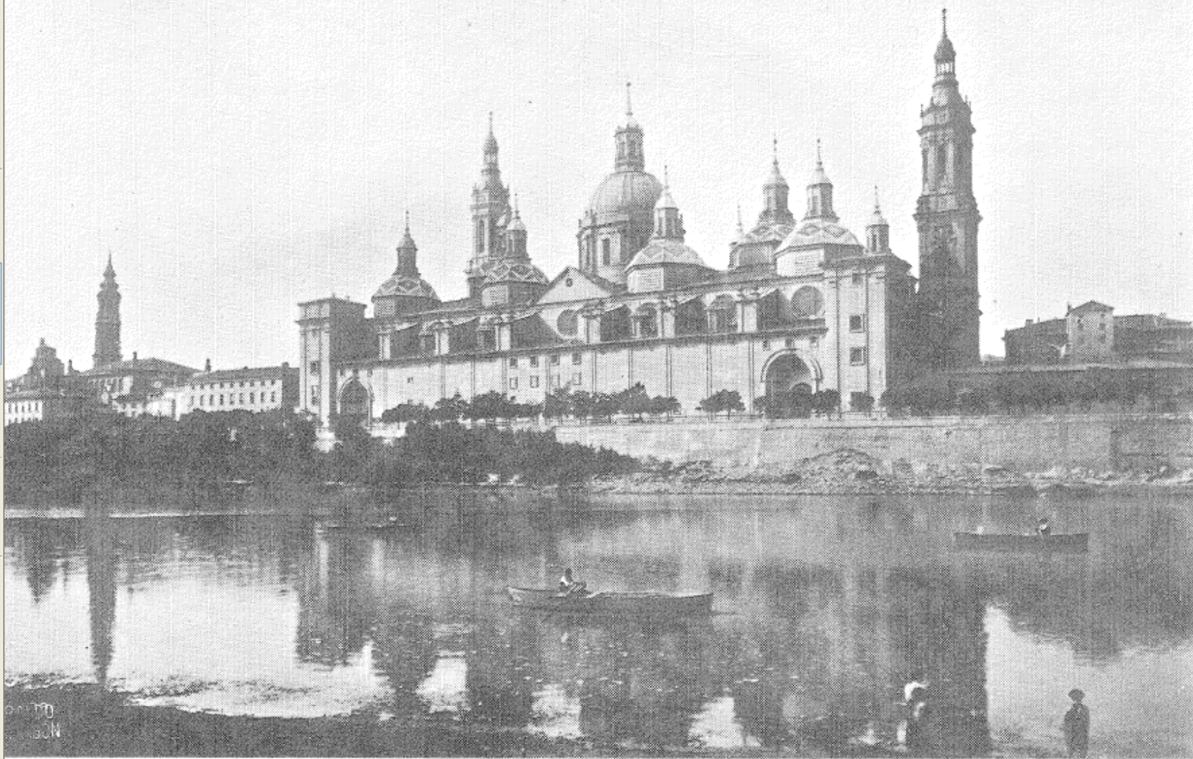
El Pilar.—A la izquierda, lejos, el cimborrio y la torre de La Seo.

.....Cien años después ¿No es momento de promover un nuevo impulso Institucional?